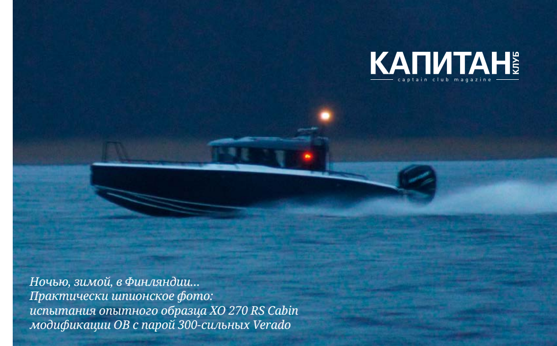
Ночью, зимой, в Финляндии... Практически шпионское фото: испытания опытного образца XO 270 RS Cabin модификации OB с парой 300-сильных Verado

270 RS Cabin OB удалось разогнать до 54 узлов, т. е. практически до 100 км/ч. Имплантации подмоторного кронштейна в самое ближайшее время ждет и новенький Front Cabin.