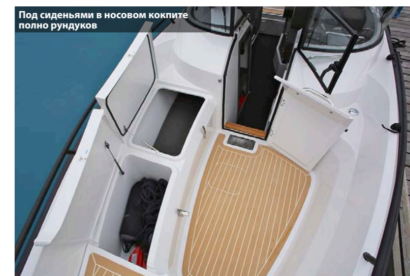
Под сиденьями в носовом кокапите полно рундуков