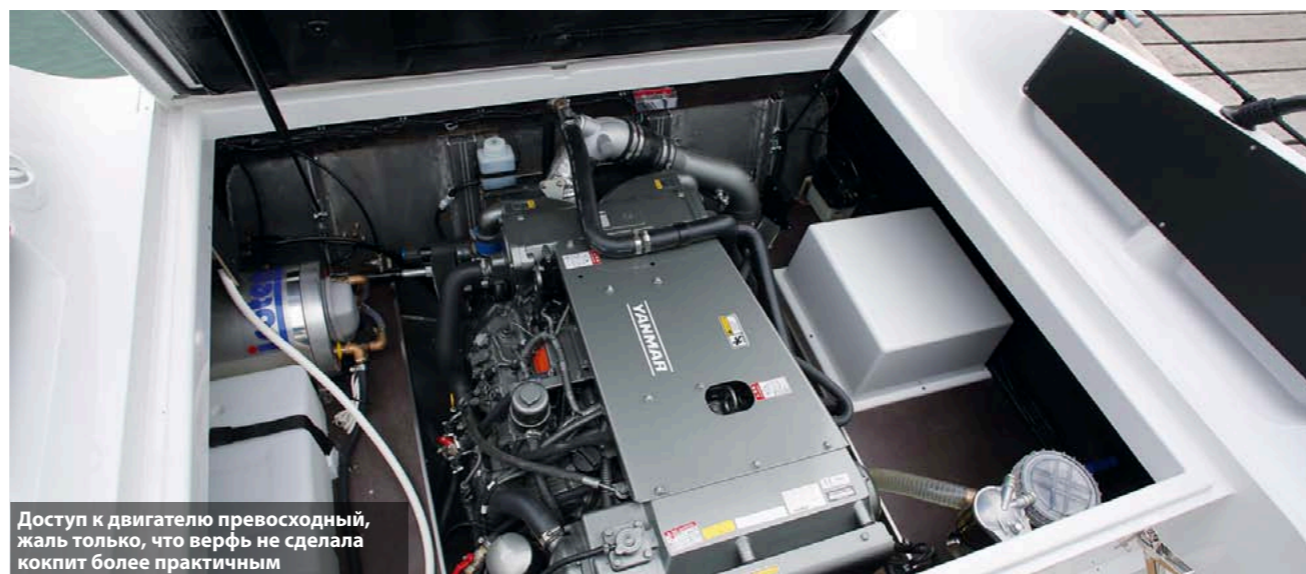
Доступ к двигателю превосходный, жаль только, что верфь не сделала кокапит более практичным