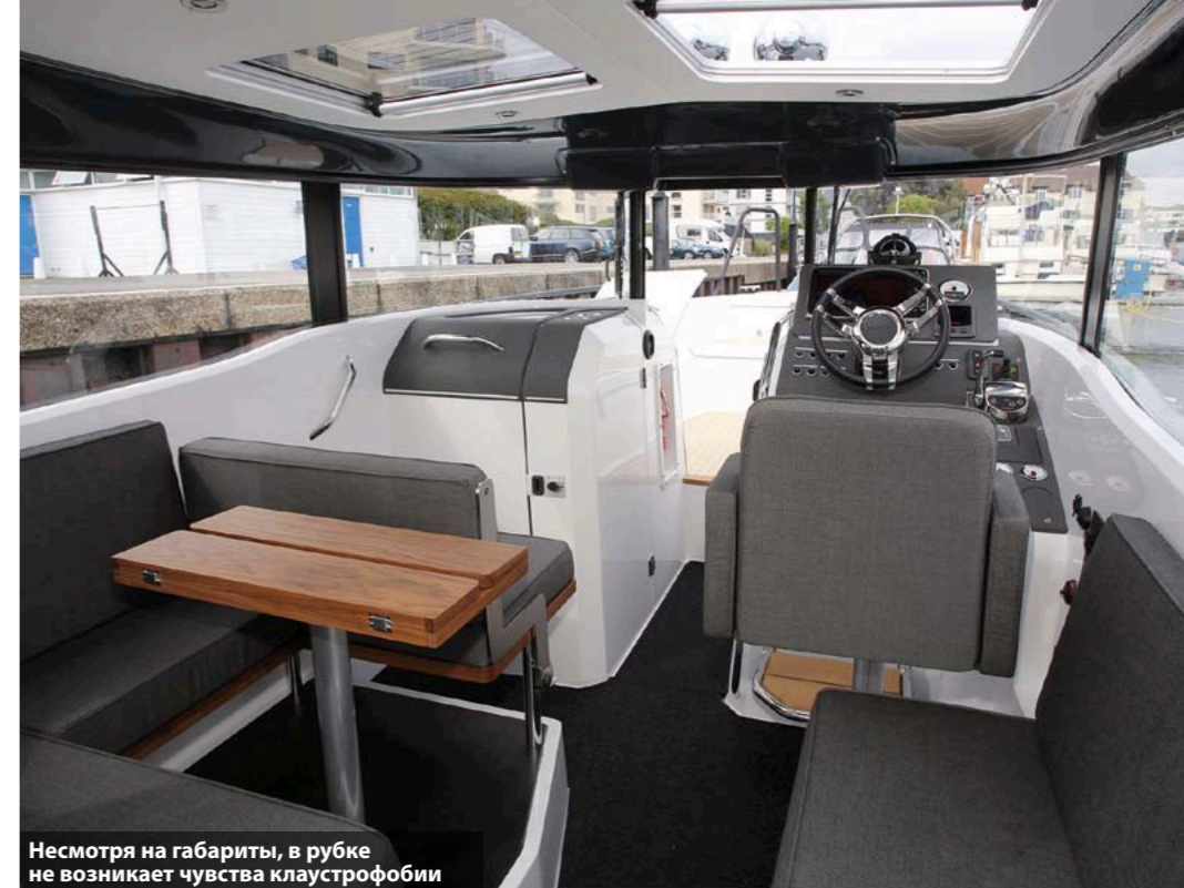
Несмотря на габариты, в рубке не возникает чувства клаустрофобии

Килеватый корпус (24° на транце) с транцевой колонкой имеет устойчивый ход и не теряет контакта с водой: в циркуляции вы скорее вылетите из кресла, чем почувствуете проскальзывание или занос. Когда скорость сброшена до круизных 30 узлов, катер тихо и уверенно мчит по водной глади «без шума и пыли». Его вес не достигает и трех тонн, но когда пытаешься на волне поднять корпус в воздух, чтобы со всей силой «грохнуть» его об воду, создается впечатление, будто истинная масса в четыре раза больше. Я пробовал снова и снова ловить волну от нашей фотолодки Botnia Targa (а волны разгонять она умеет!), насакивал на самые