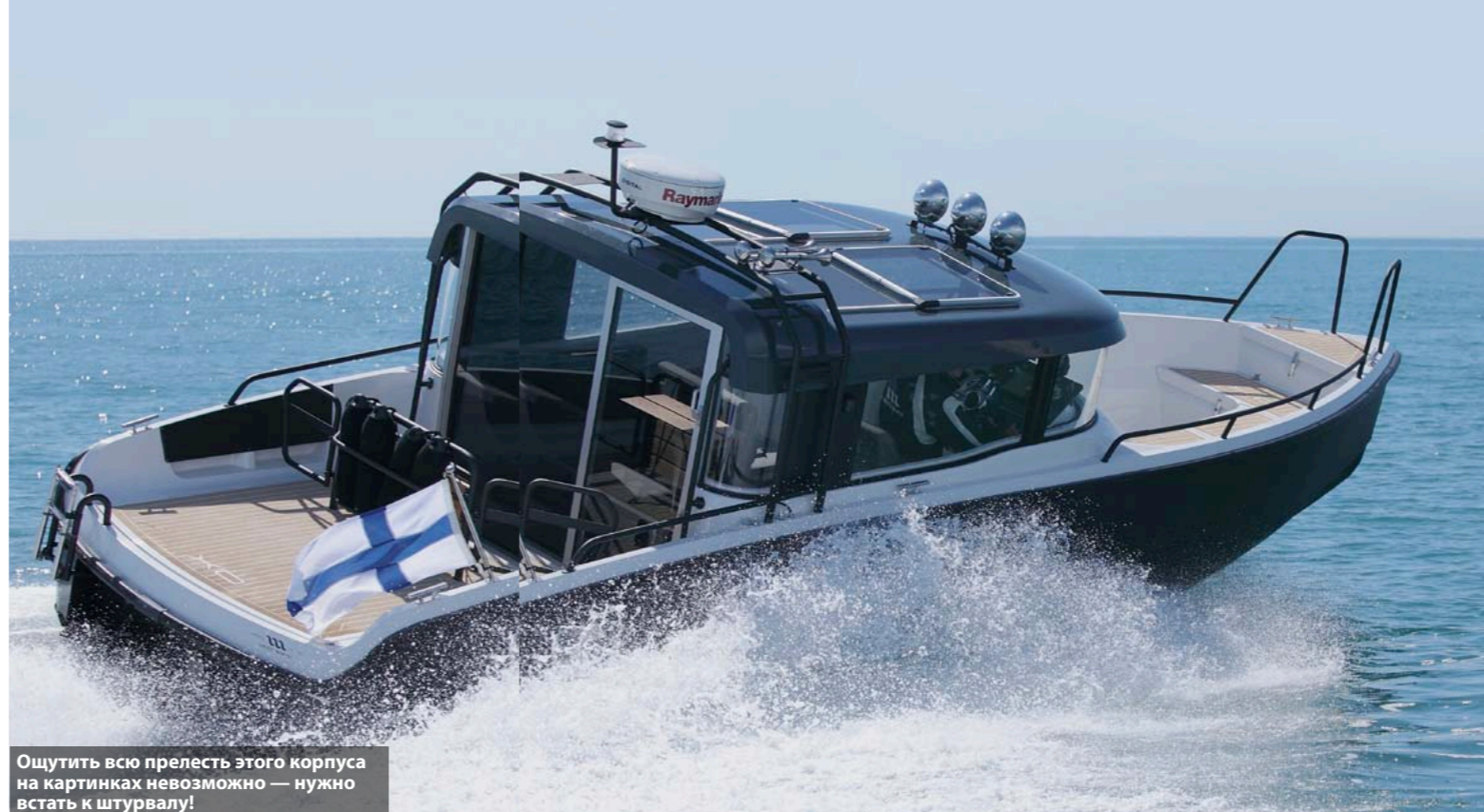
Ощутить всю прелесть этого корпуса на картинках невозможно — нужно встать к штурвалу!