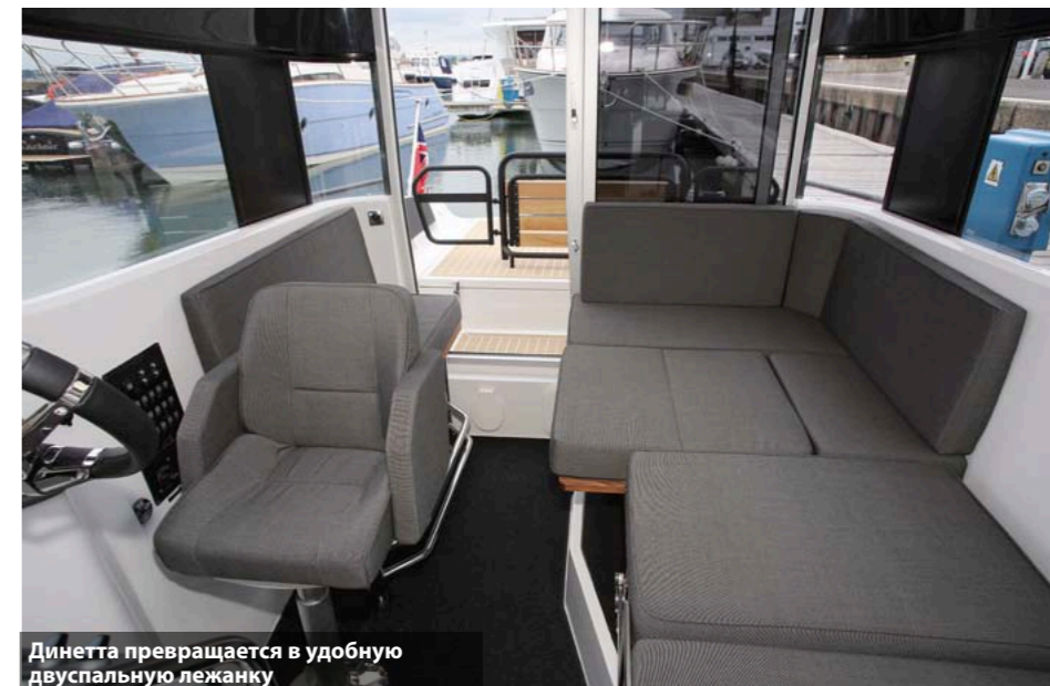
Диван превращается в удобную двухспальную лежанку

высокие гребни с максимальной скоростью и опасным курсовым углом, но все тщетно: нос даже не приподнимался, разваливая волну, как колун полено, и лодка уже оказывалась по другую ее сторону.