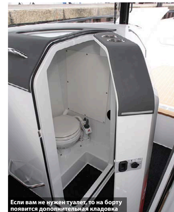
Если вам не нужен туалет, то на борту появится дополнительная кладовка